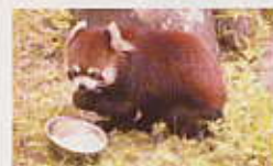
レッサーパンダ (園内マップ⑩)

そんな方のために、今回「大人限定」で飼育体験教室を開催します。たくさんのご応募お待ちしております。