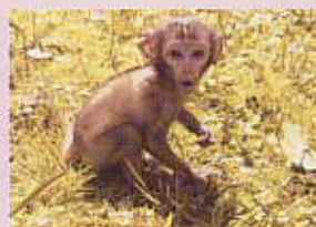
ポカポカの日光浴

生まれたとき体重476g、体長約18cm。人間の赤ちゃん用のミルクを2,3時間おきに夜中も飲ませました。最初は上手く飲むことが出来ず、注射器で少しずつ口の中に入れてあげていましたが、そのうち子猫用の哺乳瓶でも上手に飲めるようになりました。