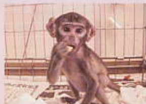
自分で食べるようになりました

生後31日目から離乳食を開始しました。最初はりんご・バナナなどの果物やパンをすりつぶして口に入れてあげました。その後、5mm角に切ってあげました。段々と自分で持って食べるようになりました。ミルクをやめて、体重の変化を観察しました。順調に体重が増えてきたので、生後79日で離乳しました。