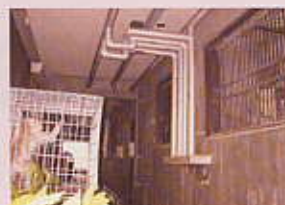
両親とオリ越しにご対面