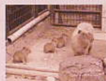
カピバラ (園内マップ④)