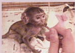
エサを食べている様子

平成21年2月18日、パタスザルの赤ちゃん(男の子)が生まれました。お母さんが臆病な性格だったせいか、残念ながら赤ちゃんを育ててくれませんでした。そこで、担当の飼育員がお母さんに代わって、世話をすることになりました。