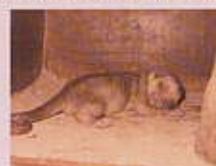
キンカジュウ 夜行性動物館(園内マップ②)