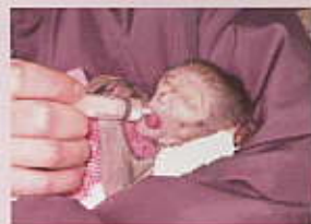
注射器でミルクを飲む様子

生まれたとき体重476g、体長約18cm。人間の赤ちゃん用のミルクを2,3時間おきに夜中も飲ませました。最初は上手く飲むことが出来ず、注射器で少しずつ口の中に入れてあげていましたが、そのうち子猫用の哺乳瓶でも上手に飲めるようになりました。