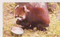
レッサーパンダ (園内マップ⑩)

動物園の飼育係ってどんな仕事をしているの知っていますか? 小さい頃、動物園で働いてみたいという夢を持っていませんか? 動物園の裏側ってどうなっているのに興味がありませんか? そんな方のために、今回「大人限定」で飼育体験教室を開催します。たくさんのご応募お待ちしております。