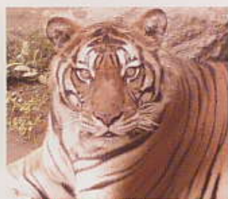
ベンガルトラ(園内マップ④)