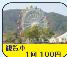
観覧車 1回 100円