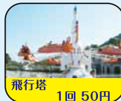
飛行塔 1回 50円