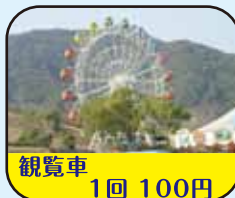
観覧車 1回 100円