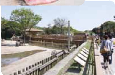
アフリカの草原ゾーン(園内マップ①)