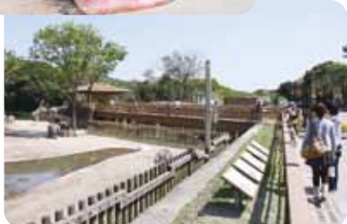
アフリカの草原ゾーン(園内マップ①)