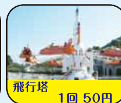
飛行塔 1回 50円