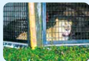
ライオン(園内マップ④)

ふだん見ることのできない夜の動物たちの様子を見てみませんか? (天候不良時は中止)