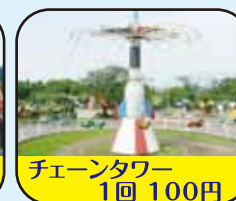
チェーンタワー 1回 100円