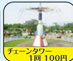
チェーンタワー 1回 100円