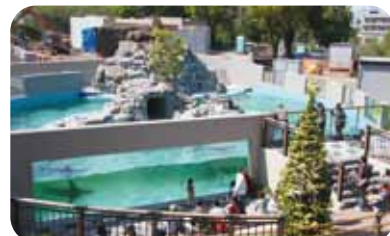
アシカ・ペリカンプール(園内マップ⑳)