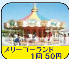
メリーゴーランド 1回 50円