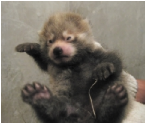
レッサーパンダの赤ちゃん誕生!!