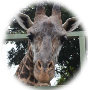
お父さんのハート