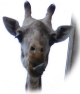
お母さんのアヤメ