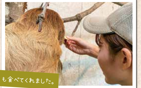
今日も食べてくれました。

病気やケガをした際に薬を与えることができるよう、毎日1本ずつ大好きな生イモスティックを手渡しで与えます。