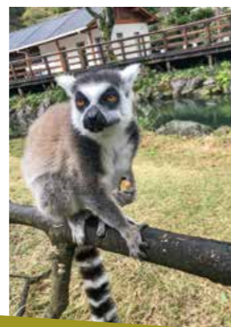
今日も一日元気に過ごします