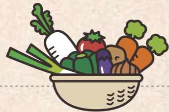
たくさんの種類を食べます!