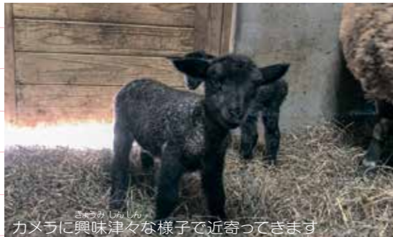
カメラに興味津々な様子で近寄ってきます

▲生まれたての双子は、見た目では判別がつかみませんでしたが、体重が大きく違いました。そこで、体重の重い方をリン(4月30日の誕生石シトリンから)、軽い方をミア(4月30日の誕生花カルミアから)と名付けました。生後3日経つと、ミアはリンに比べてあまり元気がありませんでした。産室の隅でじっとしてほとんど動かず、手を添えて立たせてもすぐ座り込んでしまうこともありましたが、それでも少しずつ体重が増え、生後6日目にはお乳を飲む様子も確認でき、ホッとしました。