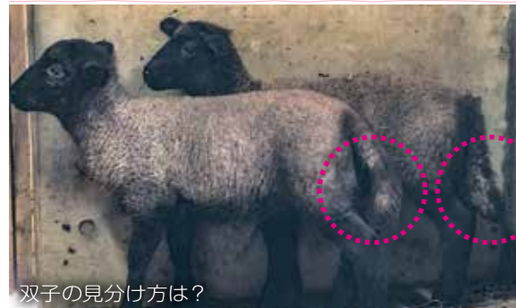
双子の見分け方は？

正解は尻尾の形です！リンは短く内巻きの尻尾(写真手前)、ミアは長く外巻きの尻尾(写真奥)をしています。ふれあいランドで、ぜひ2頭を見分けてみてくださいね！