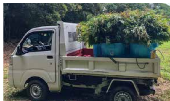
▲飼育担当者が採取したユーカリ

エンリッチメント大賞は、NPO法人市民ZOOネットワークが主催するもので、エンリッチメントに取り組む動物園や飼育担当者を応援すると同時に、来園者である市民がエンリッチメントを正しく理解・評価することにより、市民と動物園をつなぎ、市民の動物園に対する意識を高めることを目指して、2002年度より「エンリッチメント大賞」を実施しています。