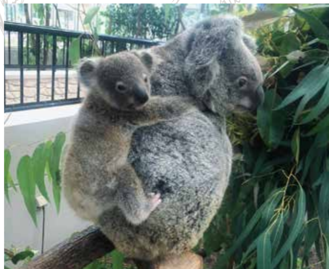
▲母親のヒマワリと、8世代目となる子ども

鹿児島市平川動物公園は日本にはじめてコアラが来園した動物園のひとつで、1984年から2021年6月まで延べ90頭を飼育してきました。動物園コアラのエサはユーカリのみで、飼育をする上でユーカリの供給は必要不可欠です。鹿児島島の温暖な気候を生かし、他園では見られない鹿児島方式として、飼育担当者が栽培から採取、給餌まで関わり行っています。飼育担当者が行うことで、好みや品質を見極めることができ、細かな給餌ケアを行い長期飼育や累代繁殖(現在は8世代)に貢献してきました。その結果が国内の50頭近いコアラの内20頭の所有権が当園にあり(2021年6月)、鹿児島方式の飼育が、国内のコアラの頭数維持や繁殖計画に大きく貢献しています。