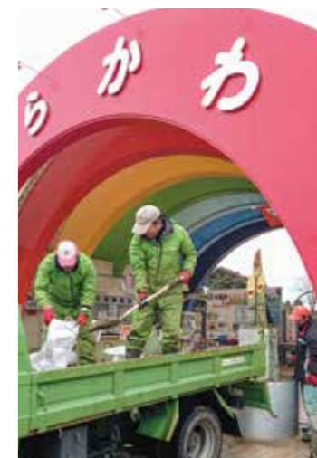
毎年飾られる門松も職員の手作りです!

など、合計約100人のスタッフが交代で休みをとりながら動物園の運営に携わっています。今回から始まった「私の必須アイテム」では、スタッフの仕事道具に焦点を当て、動物園における様々な仕事を紹介します。馴染のない道具から、こんな使い方をするの? というような道具まで登場する予定ですので、どうぞお楽しみに! それでは、第一回目のアイテムは、こちら!!