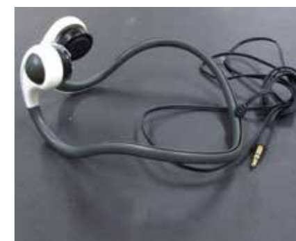
もうしばらくお世話になります

私が所属する教育普及係の業務の一つに情報発信があります。感染症対策のために開催できるイベントが減り、当園では代替として2020年4月に公式YouTubeチャンネルを開設しました。動画編集の際に欠かすことができないのが「イヤホン」です。今は驚くほど高音質のイヤホンやBluetooth対応の物がたくさんありますが、私は10年以上前に購入したこちらを愛用しています。これを選んだ理由はただ一つ。ハクジラ類の聴音の仕組み(骨伝導)を体感できるからです。パッド部分を耳の付け根周辺の骨に当てて使います。耳の中に入れるタイプではないので耳が痛くなりませんし、外の音を把握しながら作業することができるのも気に入っています(集中したい時は、パッドで耳を塞いで使っています)。これを相棒に、どんどん動画をアップしていきますので、ぜひチャンネル登録をお願いします!(平川動物公園公式HPからお入りください)