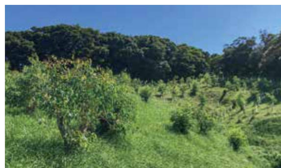
▲鹿児島市内のユーカリ園場

鹿児島市平川動物公園は日本にはじめてコアラが来園した動物園のひとつで、1984年から2021年6月まで延べ90頭を飼育してきました。動物園コアラのエサはユーカリのみで、飼育をする上でユーカリの供給は必要不可欠です。鹿児島島の温暖な気候を生かし、他園では見られない鹿児島方式として、飼育担当者が栽培から採取、給餌まで関わり行っています。飼育担当者が行うことで、好みや品質を見極めることができ、細かな給餌ケアを行い長期飼育や累代繁殖(現在は8世代)に貢献してきました。その結果が国内の50頭近いコアラの内20頭の所有権が当園にあり(2021年6月)、鹿児島方式の飼育が、国内のコアラの頭数維持や繁殖計画に大きく貢献しています。