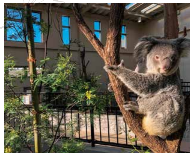
▲自然光溢れる新施設で日光浴

※エンリッチメントとは、「動物福祉の立場から、飼育動物の“幸福な暮らし”を実現するための具体的な方策」とし、動物たちの暮らしが、豊かで充実したものになるような取り組みをいいます。