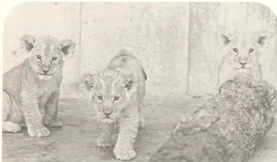
▲ライオンの赤ちゃん誕生!