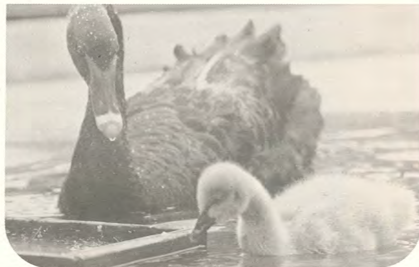
▲黒鳥(オーストラリア産)の赤ちゃんです。