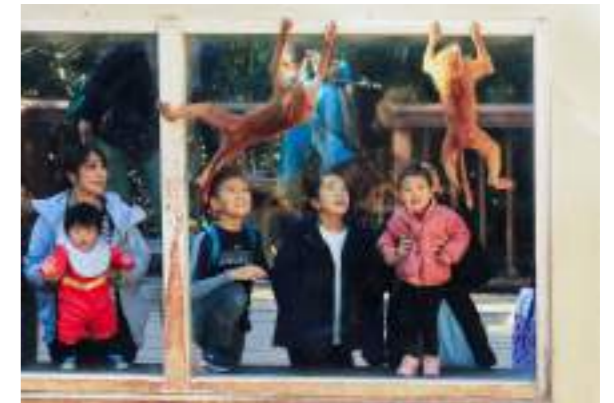
昨年度鹿児島市長賞：楽しい日